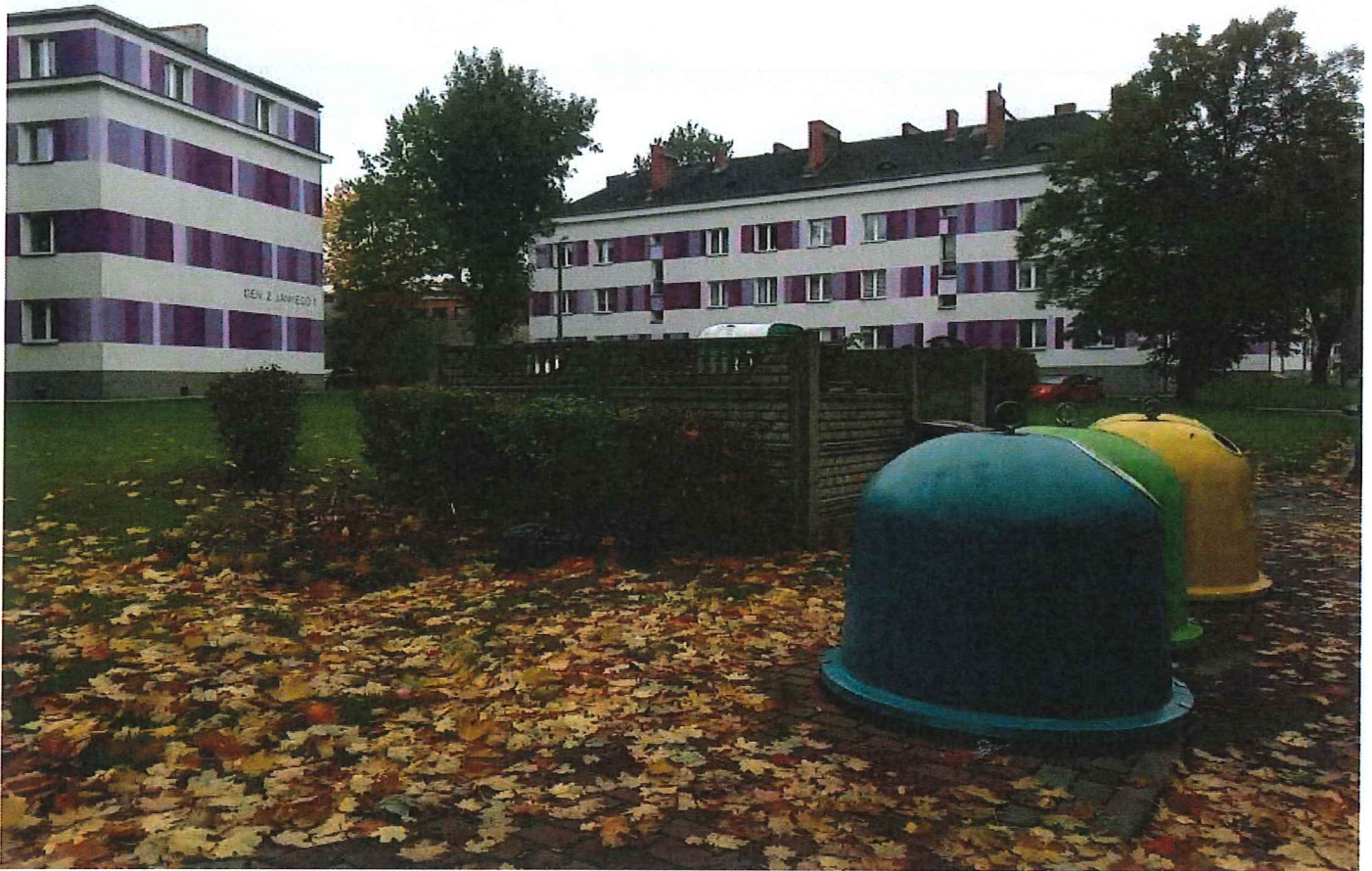
Fot. 2,3Widok istniejącego placyka gospodarczego na działce od strony ulicy Stanisława Mastalerza;