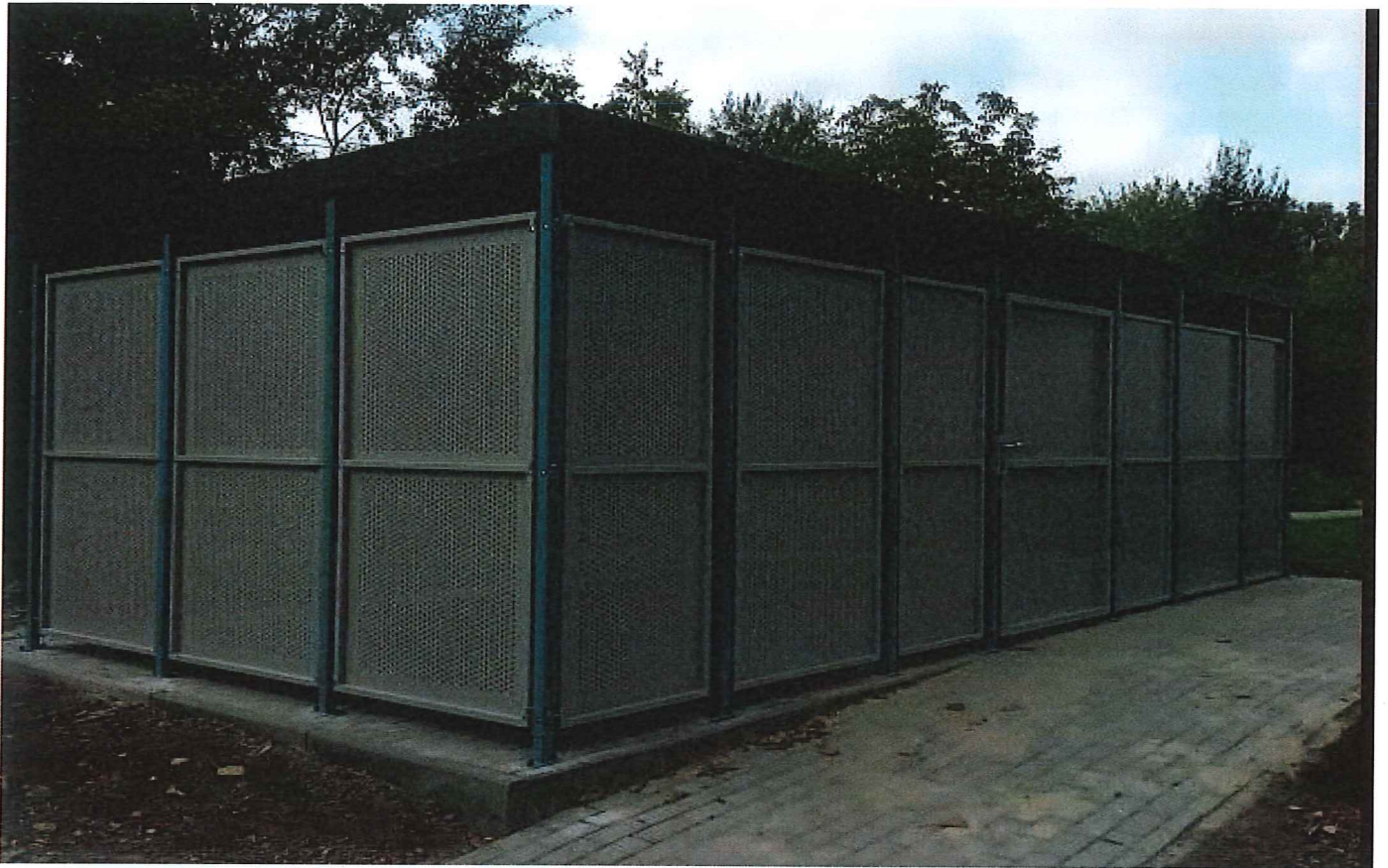
Fot. 4, Załącznik- przykładowa karta katalogowa producenta wiat śmietnikowych;