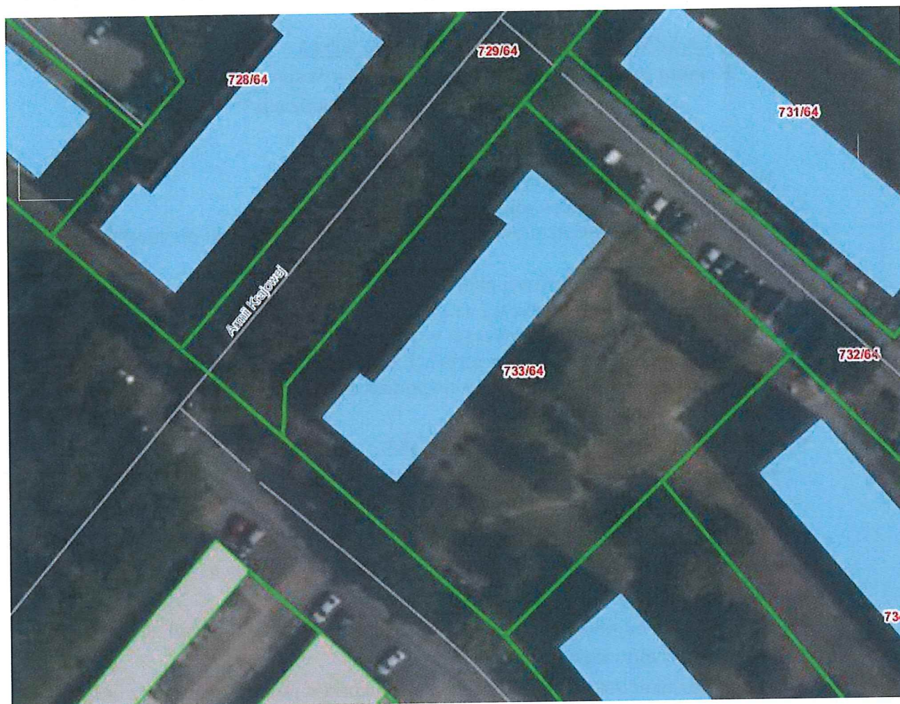
Plan sytuacyjny budynku przy ul. Armii Krajowej 4 w Piekarach Śląskich