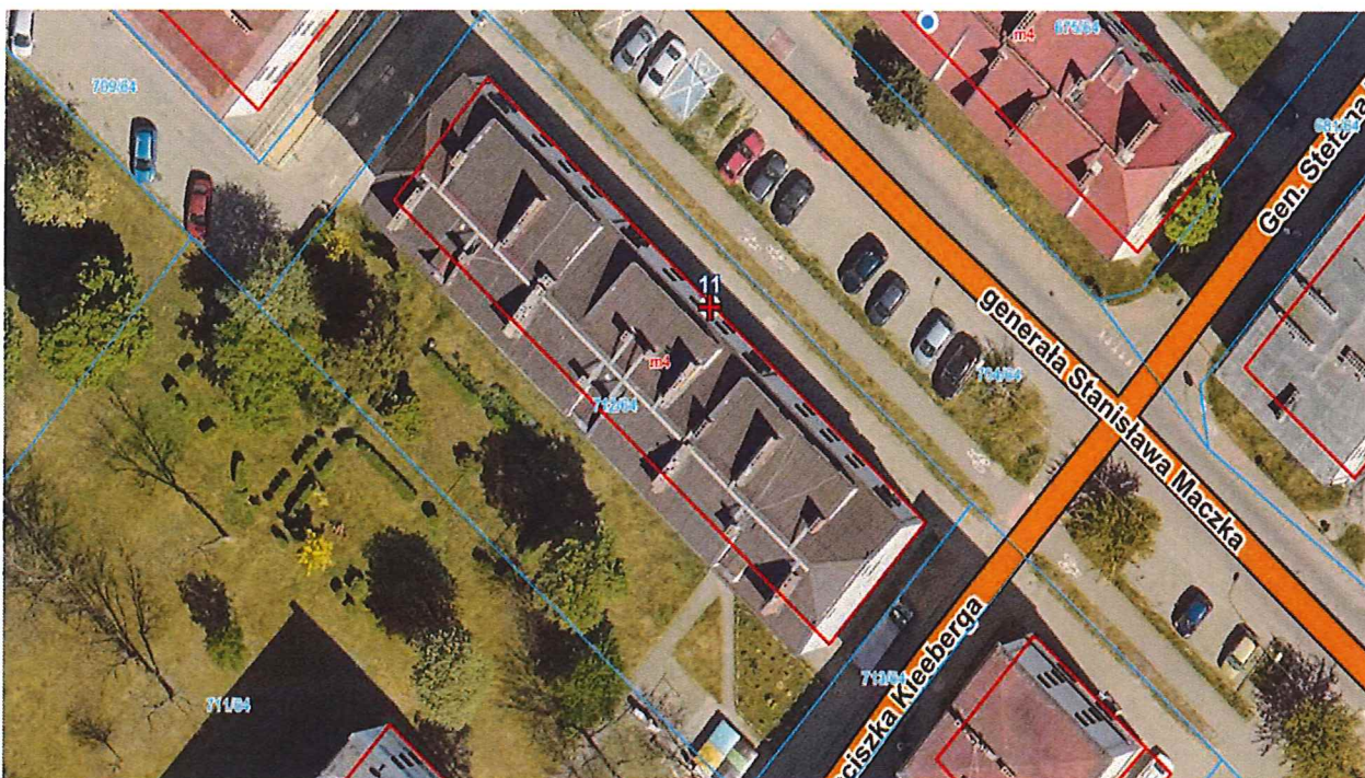
Sytuacja budynku Wspólnoty Mieszkaniowej przy ulicy. Gen. Maczka 11 w Piekarach Śląskich;