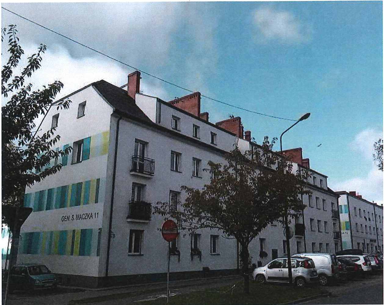
Foto 1- Widok Ogólny budynku Wspólnoty Mieszkaniowej od strony ulicy.