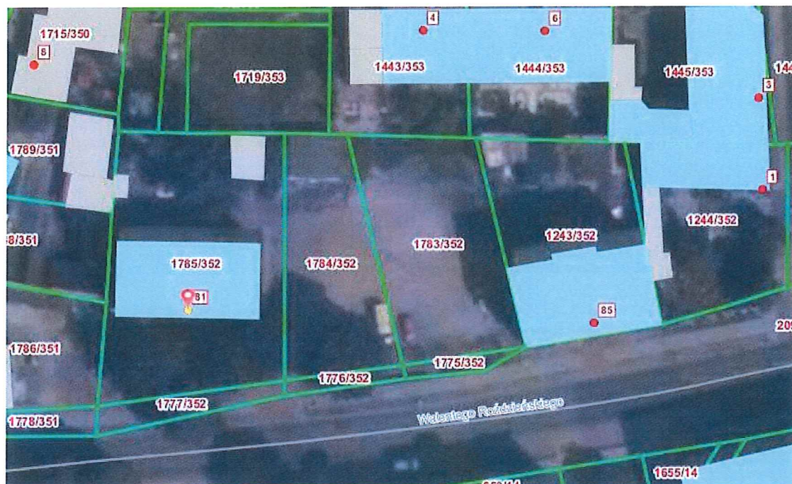
Rys. 1. Lokalizacja