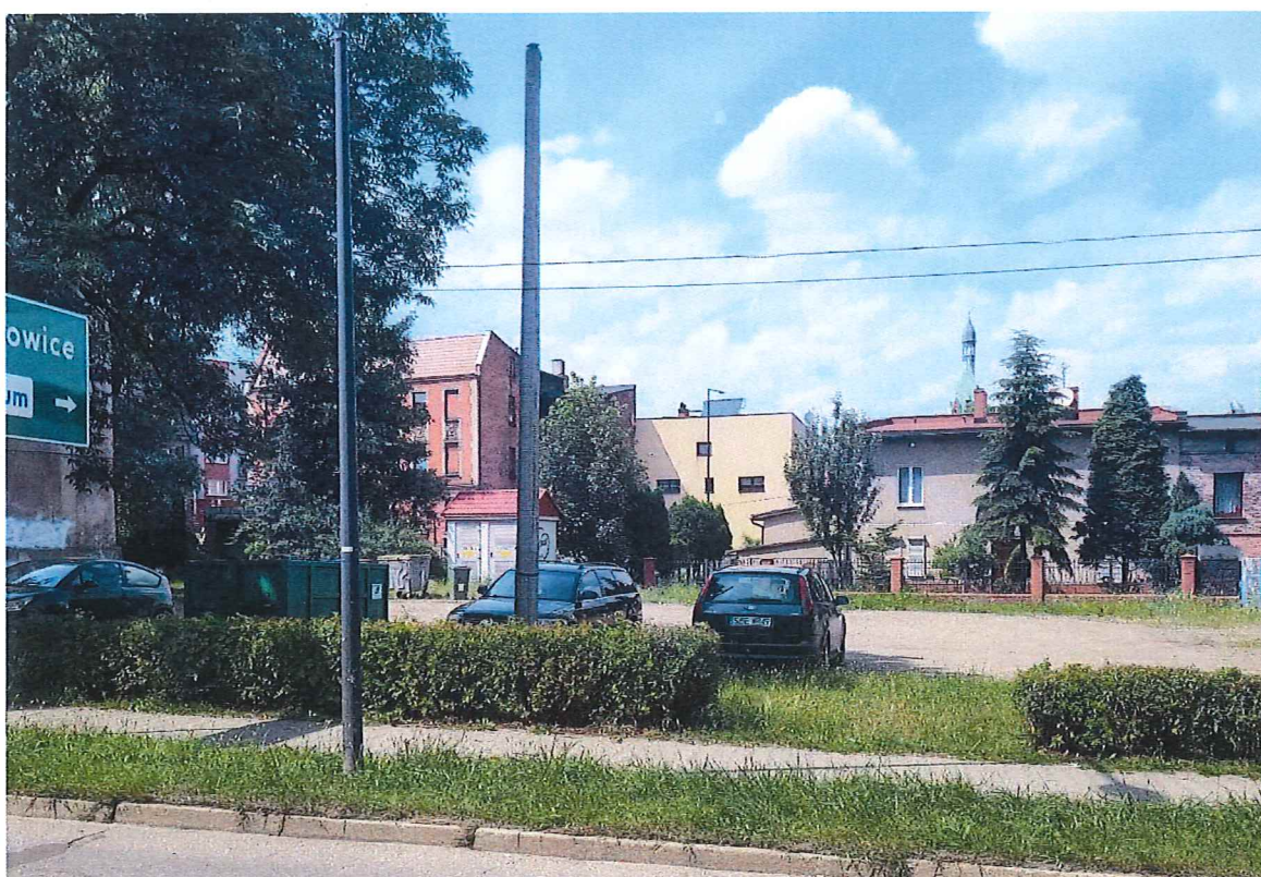
Fot. 1 Widok na teren inwestycji