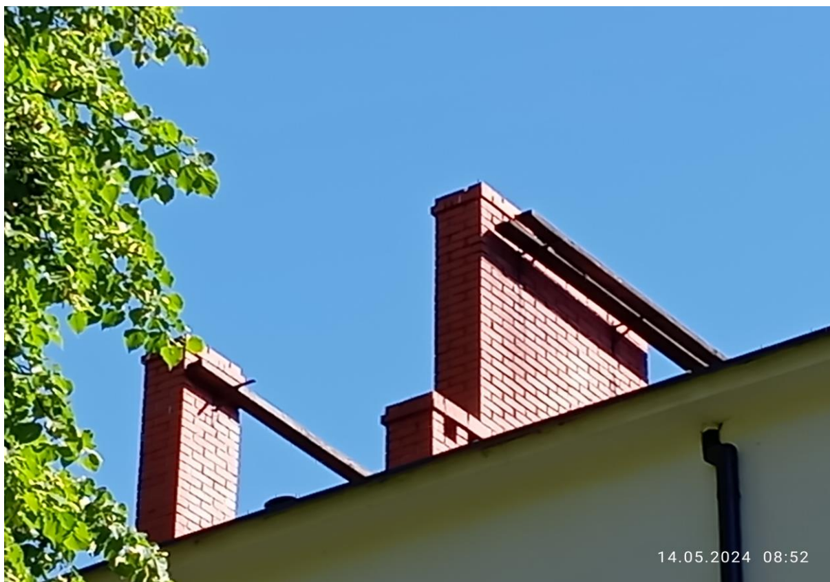
3/ Widok ogólny istniejących drewnianych ław kominiarskich.