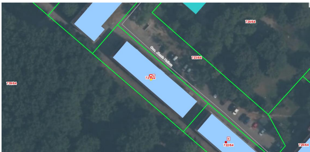
1/ Widok i sytuacja budynku przy ul. Gen. Hallera 6 w Piekarach Śląskich