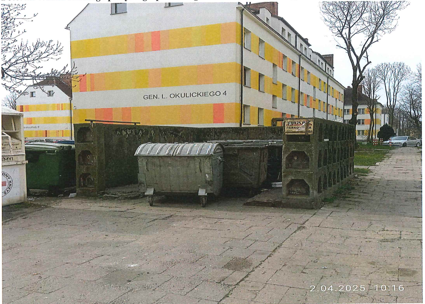
Foto 3. Wyciąg z dokumentacji z miejscem zabudowy pojemników półpodziemnych;