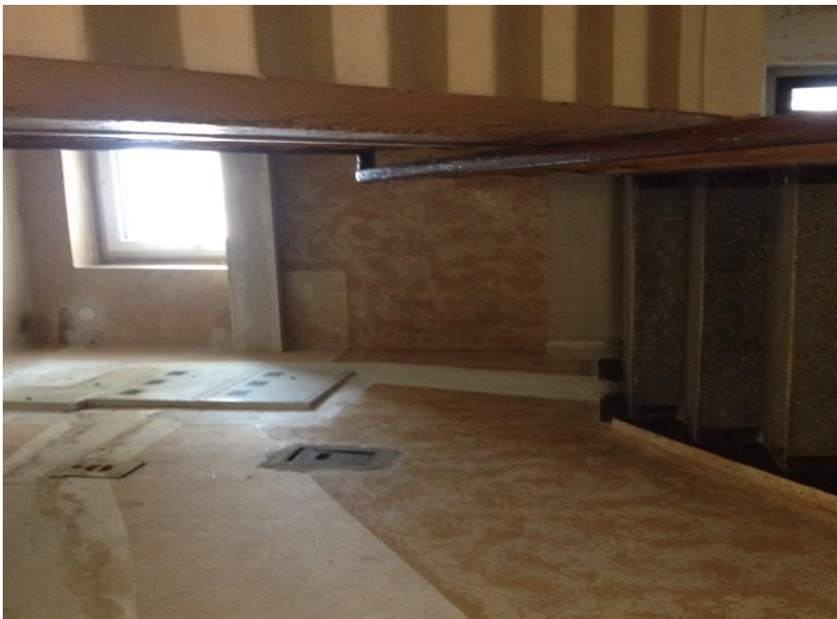
Foto nr 4- rzut powtarzalnej klatki schodowej w budynku