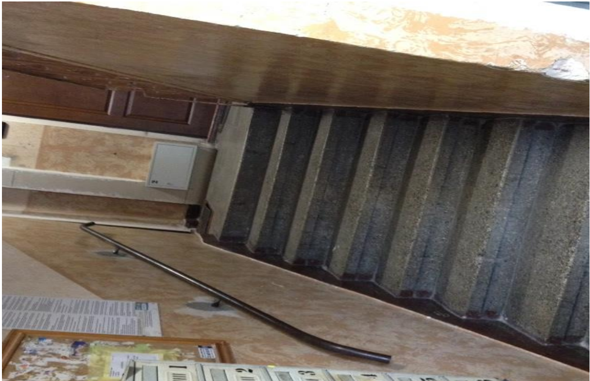
Foto nr 3- widok ogólny klatki budynku przy ulicy Ks. Kpt. Gerarda Waculika 7