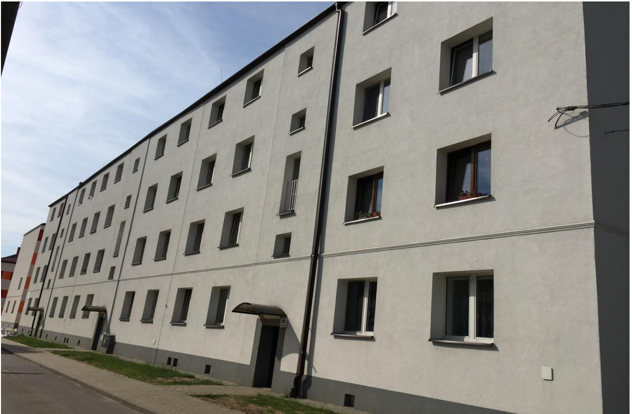
Foto nr 2- widok ogólny budynku przy ulicy Ks. Kpt. Gerarda Waculika 7