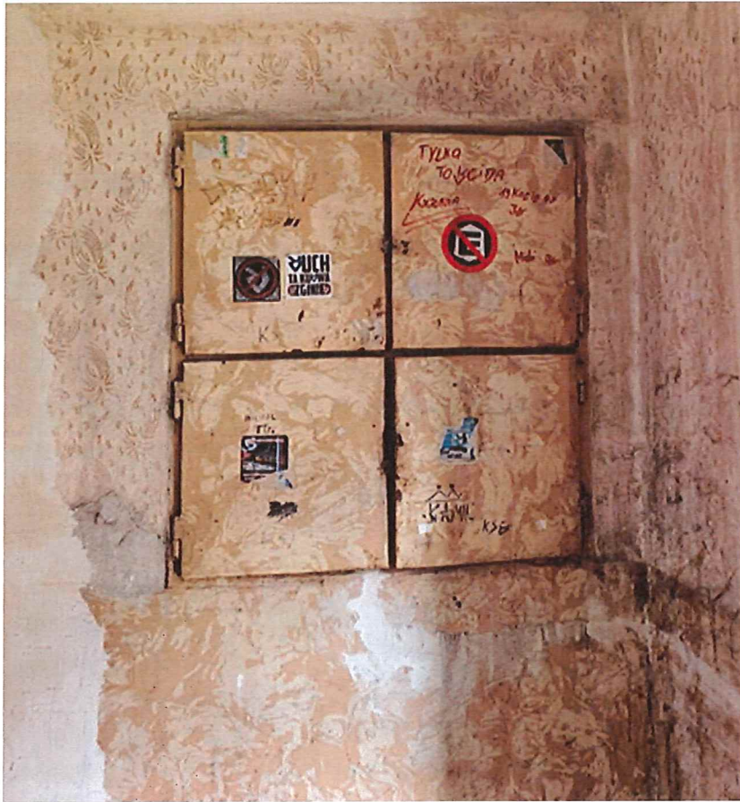
Foto 2- Widok Ogólny fragmentu klatki oraz tablic elektrycznych; parter, piętra;