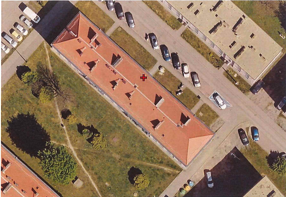
Mapa sytuacyjna budynku przy ulicy. Armii Krajowej 3 w Piekarach Śląskich;