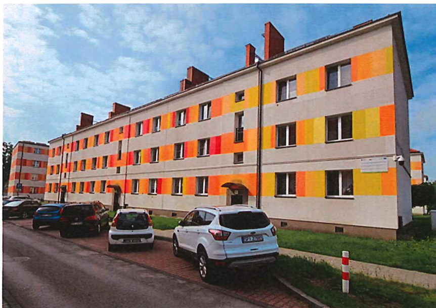
Foto 1- Widok Ogólny budynku przy ulicy Armii Krajowej 3 w Piekarach Śląskich.