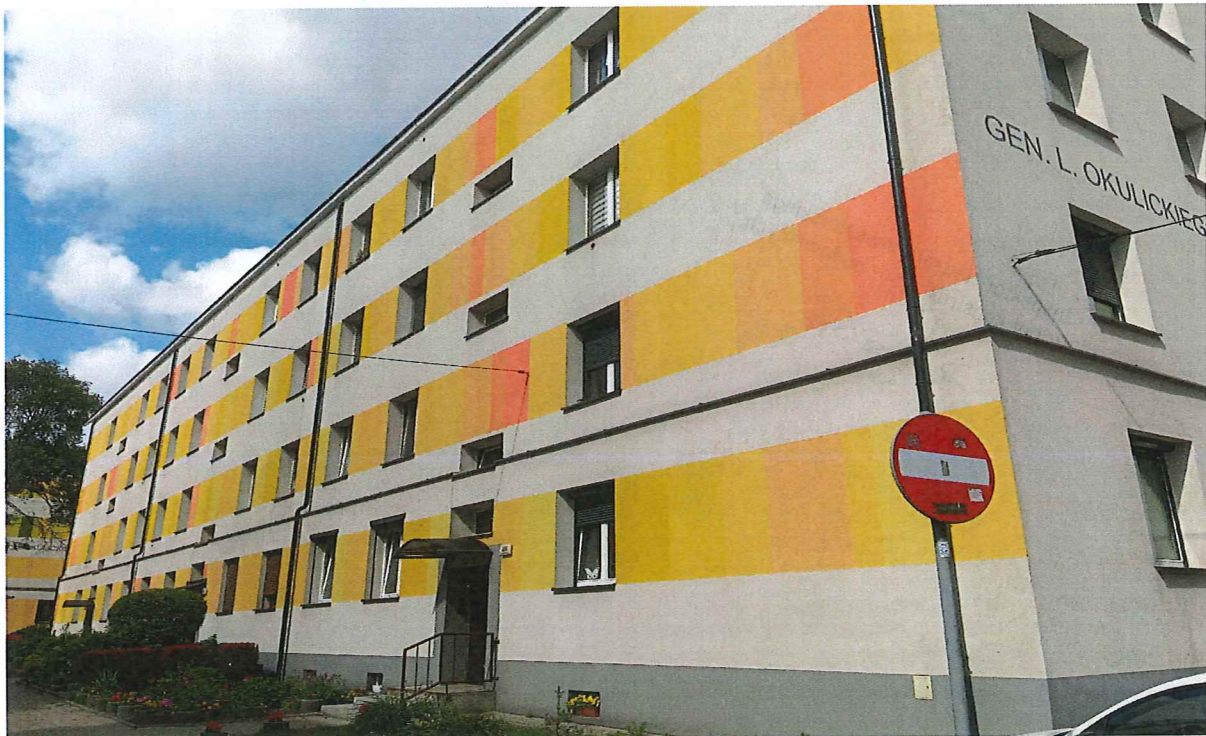
Foto. 1, 2 Widok ogólny budynku oraz powtarzalnych drzwi wejściowych do klatki schodowej.