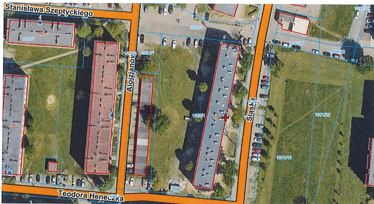
Załącznik nr 2: Miejsca planowych prac brukarskich