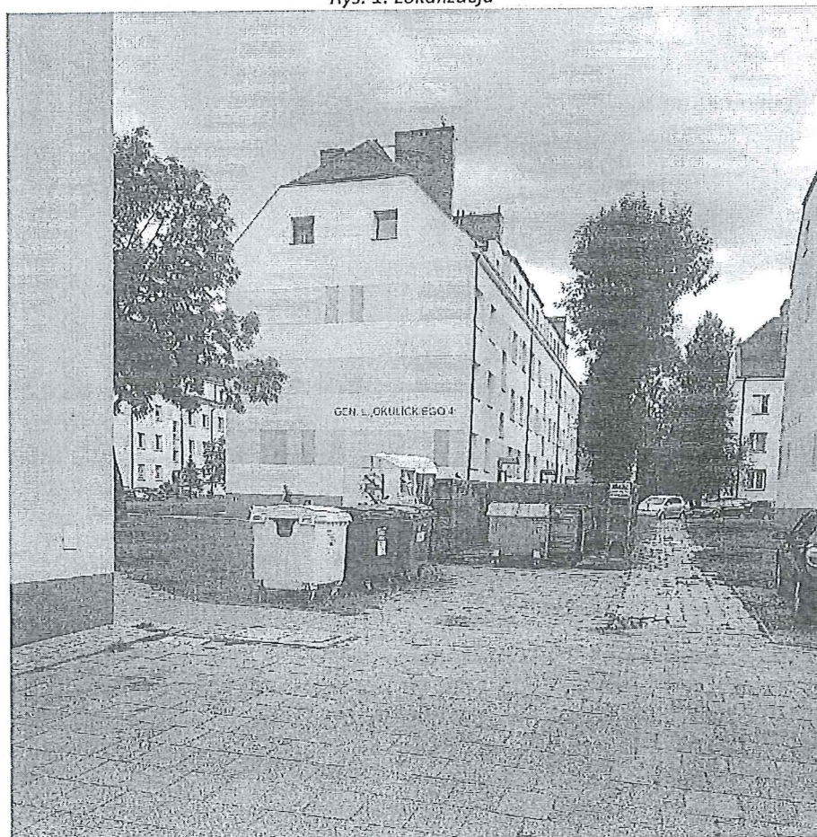
Fot. 1 Widok na istniejący śmietnik