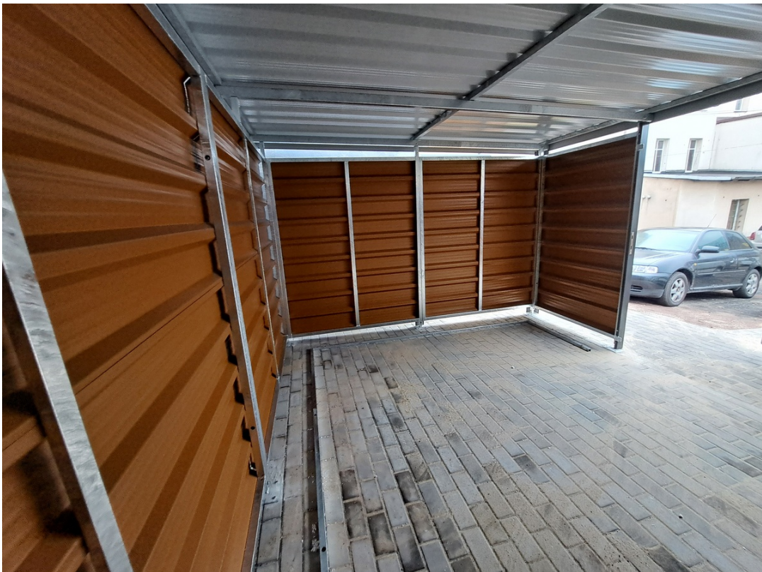
Fot. 5. Sugerowany widok wiaty w celu ujednolicenia wizerunku na terenie ADM-1.