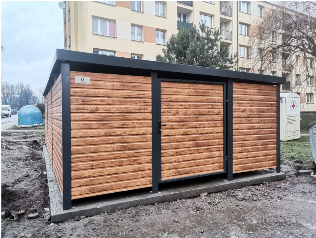
Fot. 2. Sugerowany widok wiaty w celu ujednoczenia wizerunku na terenie Administracji nr 1.