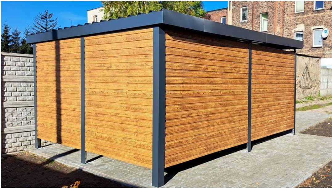
Fot. 4. Sugerowany widok wiaty w celu ujednolicenia wizerunku na terenie ADM-1.