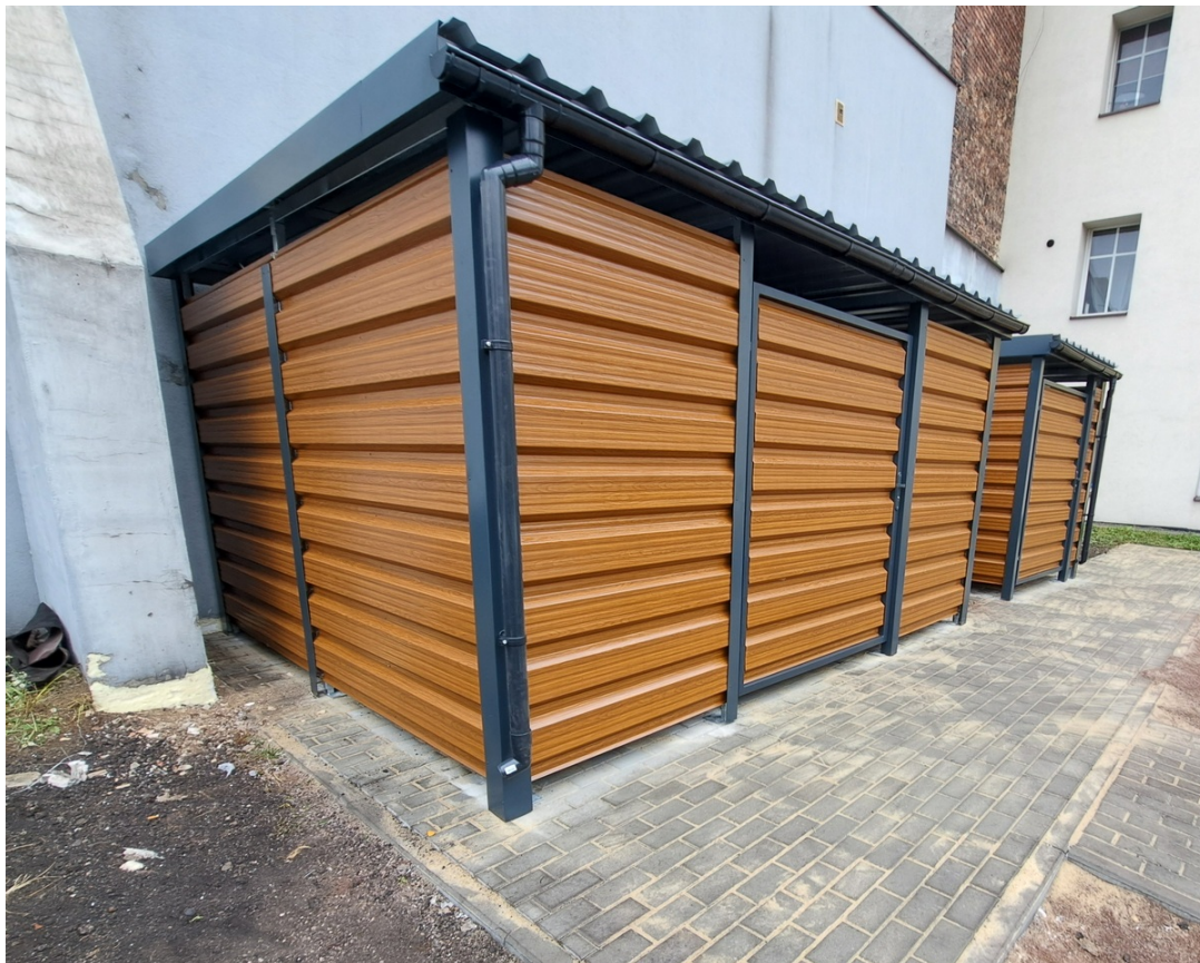
Fot. 3. Sugerowany widok wiaty w celu ujednoczenia wizerunku na terenie ADM-1.