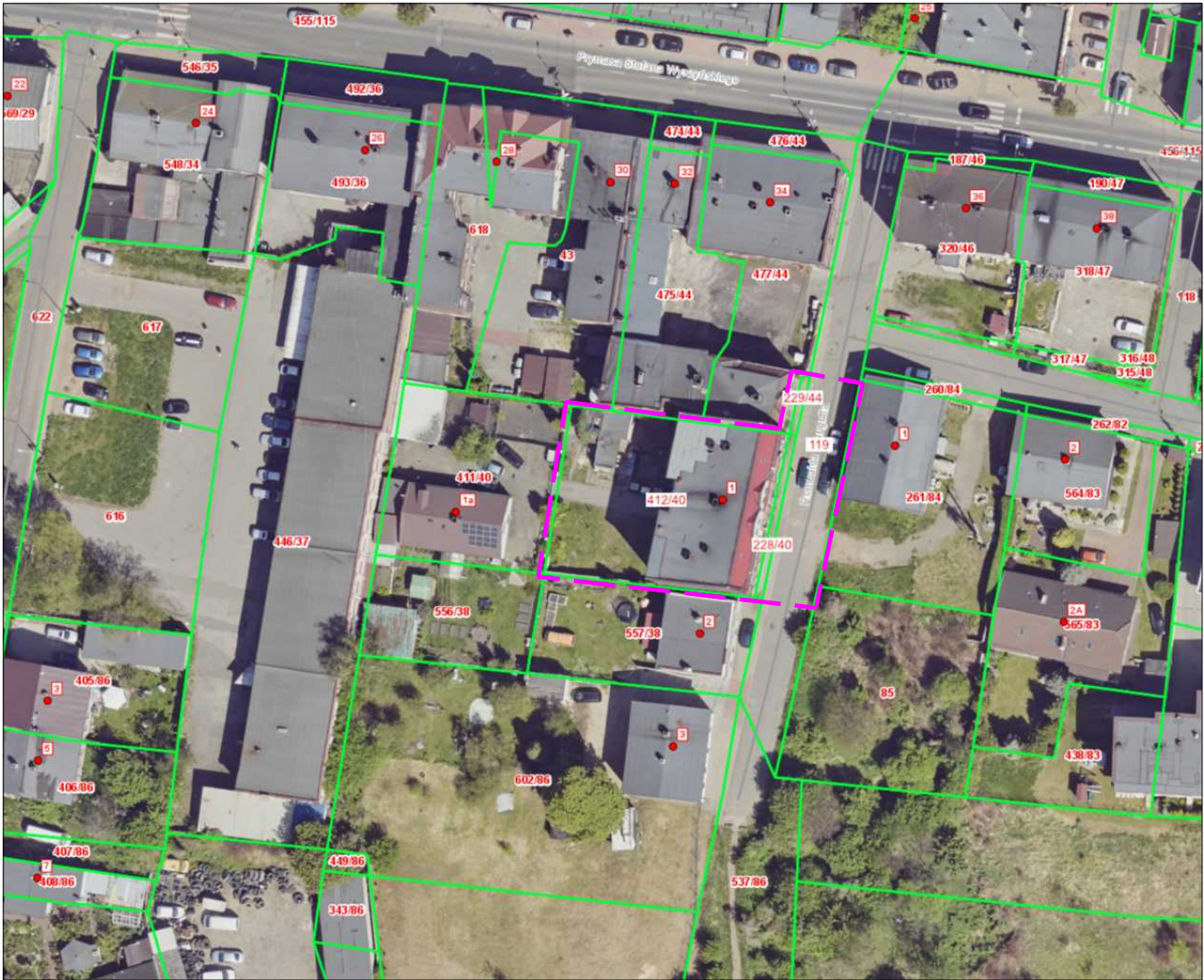
RYS. PT-01. ORIENTACJA