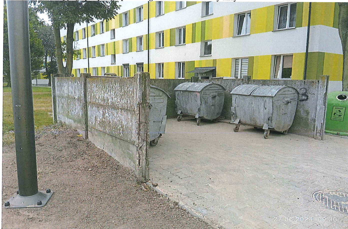
Fot. 3. Widok istniejącego placzka gospodarczego na działce od strony zieleńca