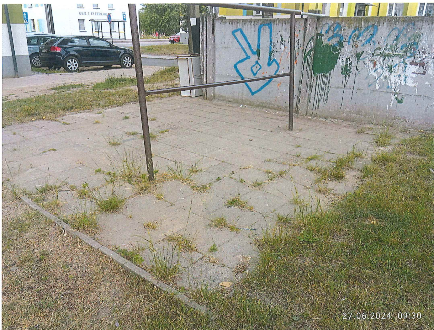
Fot. 4 Widok ogólny wymaganej wiaty śmietnikowej wraz z kolorystyką