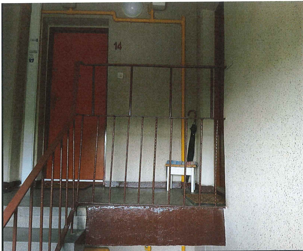
Fot. 5. Propozycja podwyższenia balustrad (ostatnie piętro).