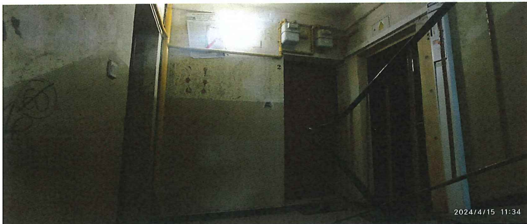
Fot. 1. Widok klatki schodowej.