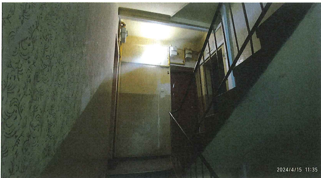
Fot. 3. Widok klatki schodowej