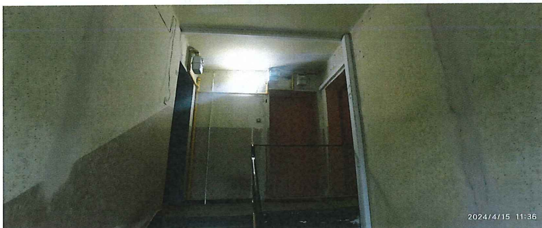
Fot. 2. Widok klatki schodowej (ostatnie piętro).