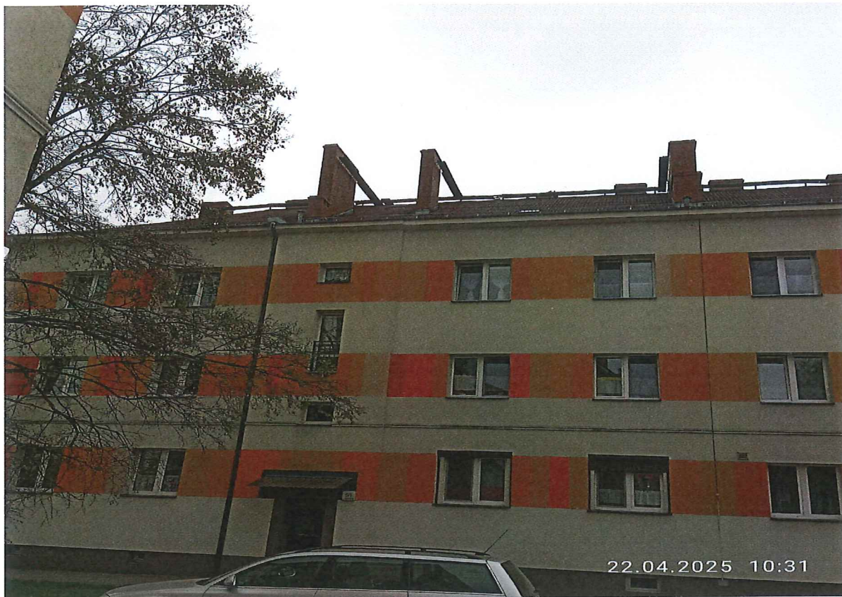
3,3a / Widok ogólny budynku, połaci dachu oraz istniejących drewnianych ław kominiarskich.