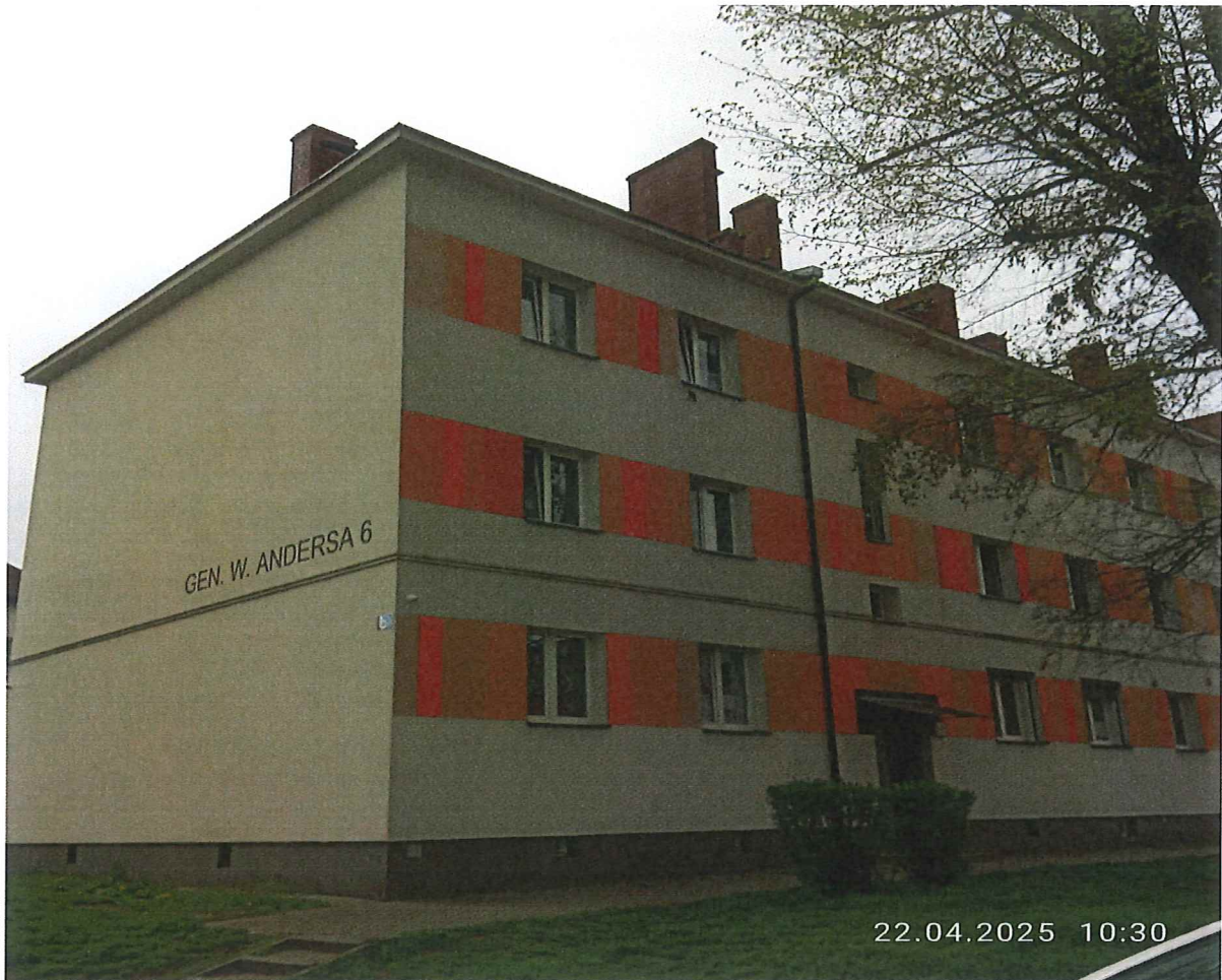
2,2a / Widok ogólny budynku, połaci dachu oraz istniejących drewnianych ław kominiarskich.