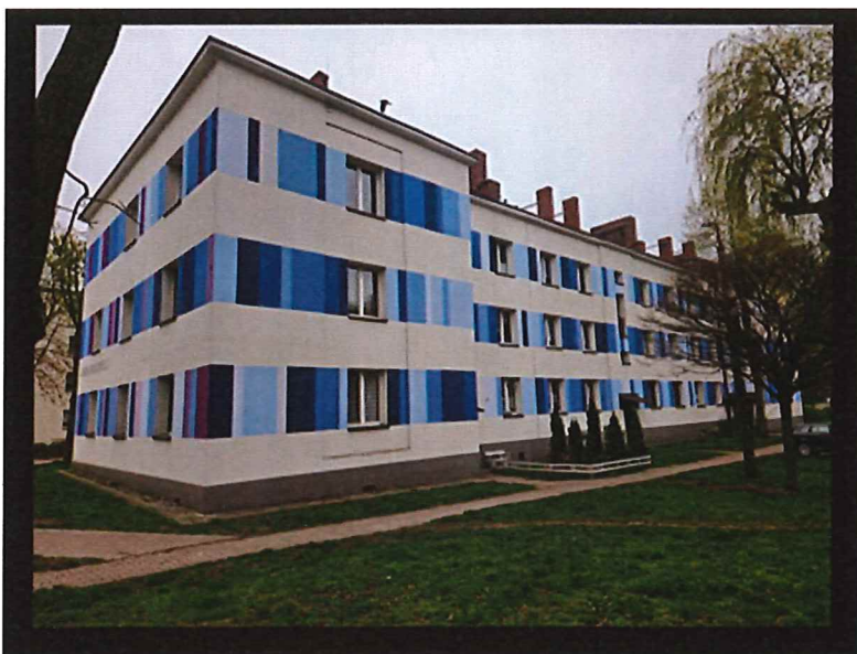
Foto 1- Widok Ogólny budynku przy ulicy Armii Krajowej 3 w Piekarach Śląskich.