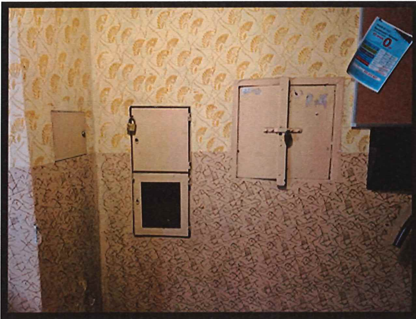
Foto 2- Widok Ogólny fragmentu klatki oraz tablic elektrycznych; parter, piętra;