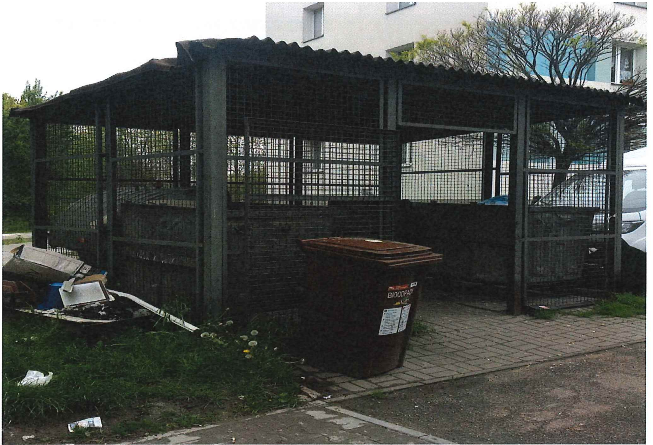
Fot. 2,3 Widok istniejącego placyka gospodarczego na działce od strony ul. Gen. Kleeberga