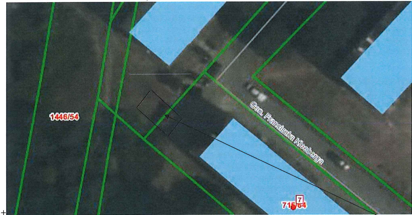
Fot. 1. Plan sytuacyjny działki, 247101_1.0002.AR_3-8.706/64 oraz 247101_1.0002.AR_3-8.715/64