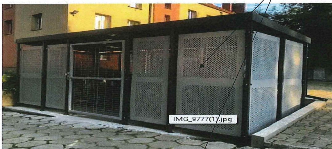
Fot. 4, Widok karty katalogowej oraz wiaty śmietnikowej do zabudowy