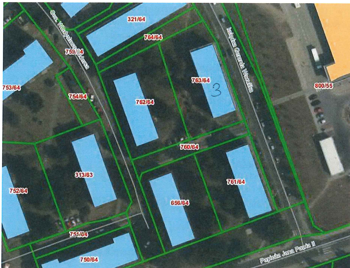
Plan sytuacyjny budynku przy ul. Ks. Kpt. Waculika 3 w Piekarach Śląskich