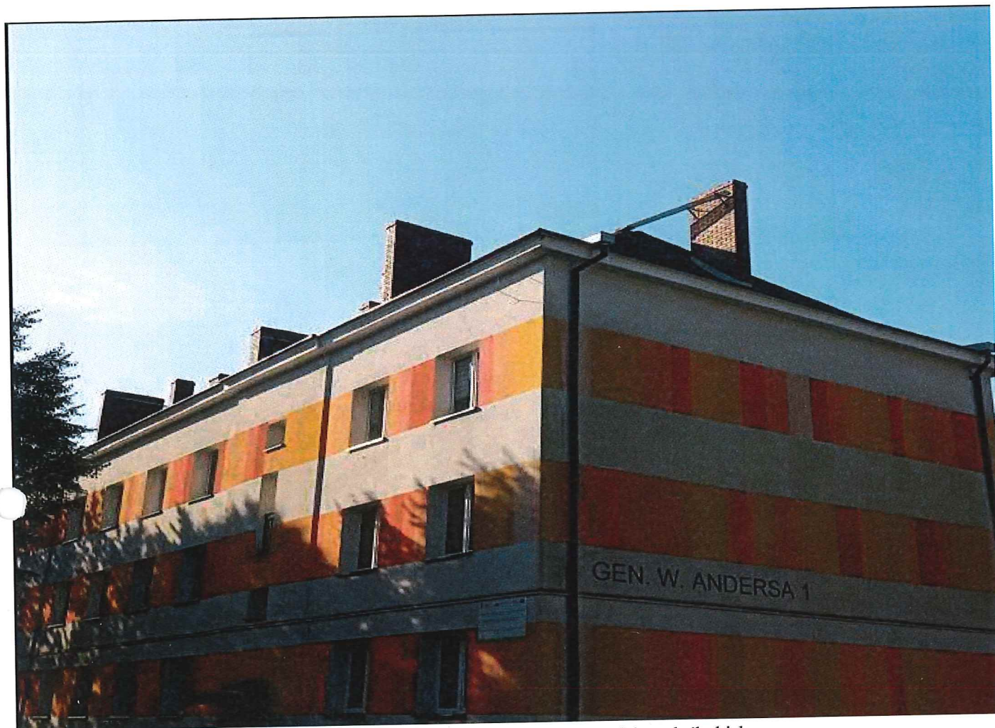
Widok ogólny budynku Wspólnoty Mieszkaniowej przy ul. Gen. Andersa 1 w Piekarach śląskich;