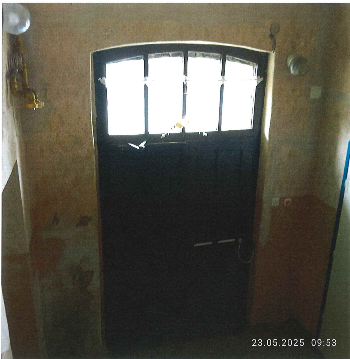
Foto 2 / Widok ogólny drzwi wejściowych do budynku od strony wewnętrznej- klatki schodowej; Piekary Śląskie, 23.05.2025