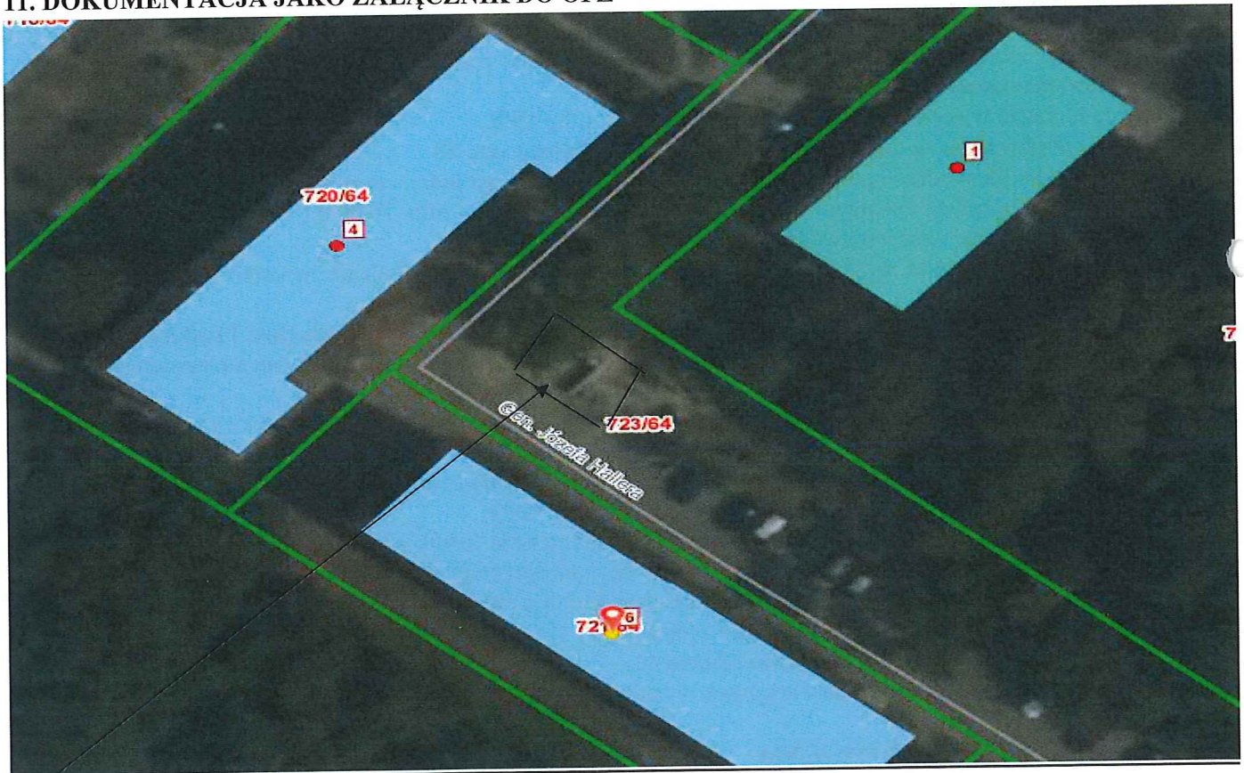
Fot. 1. Plan sytuacyjny działki, 247101_1.0002.AR_3-8.720/64 oraz 247101_1.0002.AR_3-8.721/64