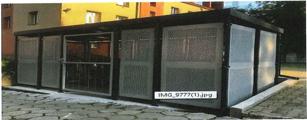
Fot. 4. Widok karty katalogowej oraz przykładowej wiaty śmietnikowej do zabudowy