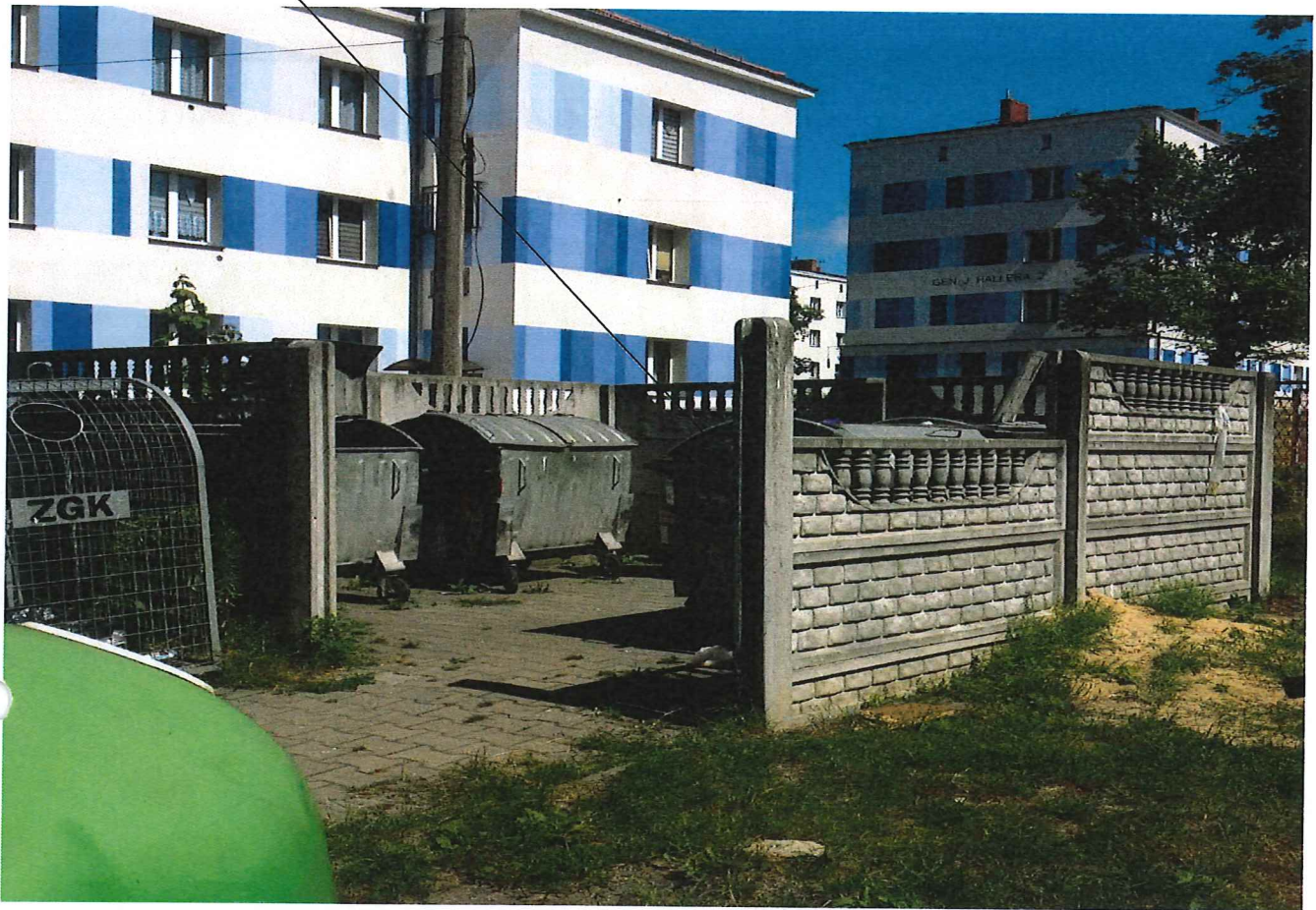
Fot. 2,3 Widok istniejącego placzka gospodarczego na działce od strony ul. Gen. Kleeberga