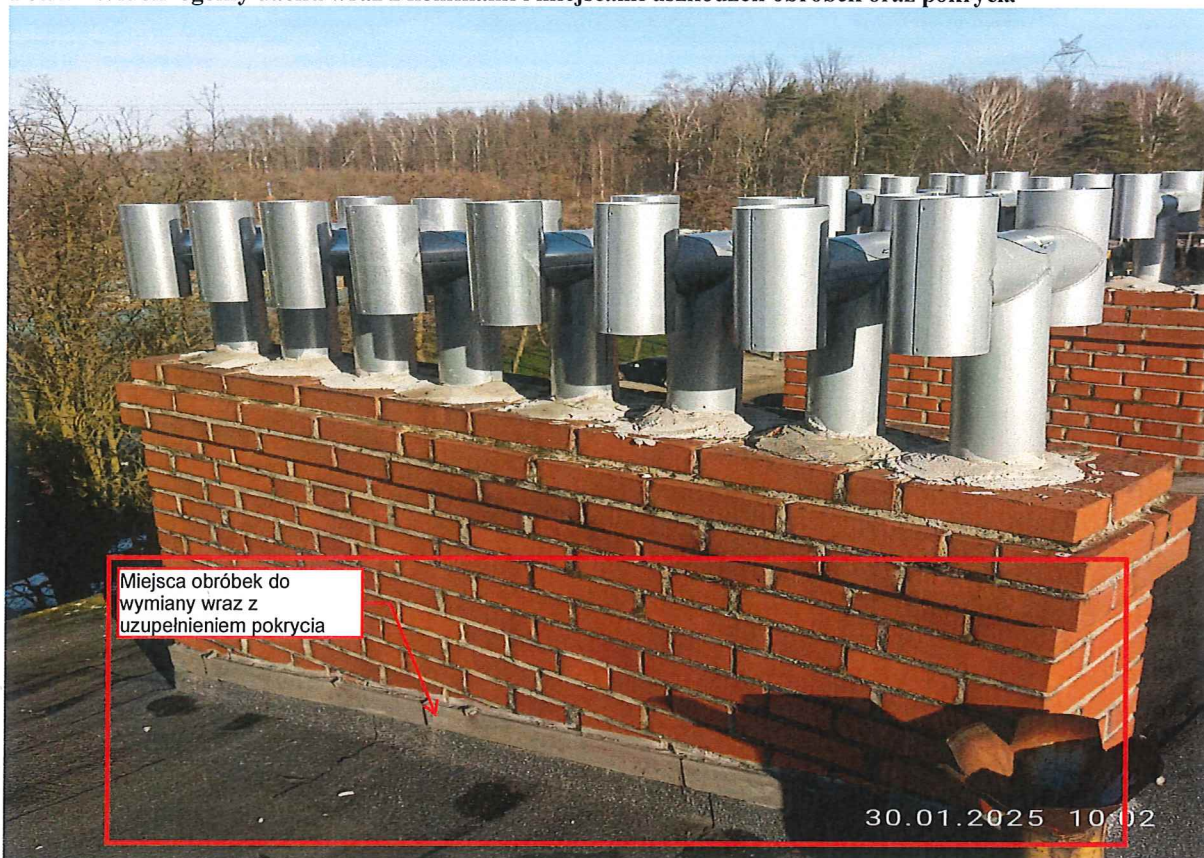
Fot. 2 Widok ogólny dachu wraz z kominami i miejscami uszkodzeń oraz nieszczelności obróbek