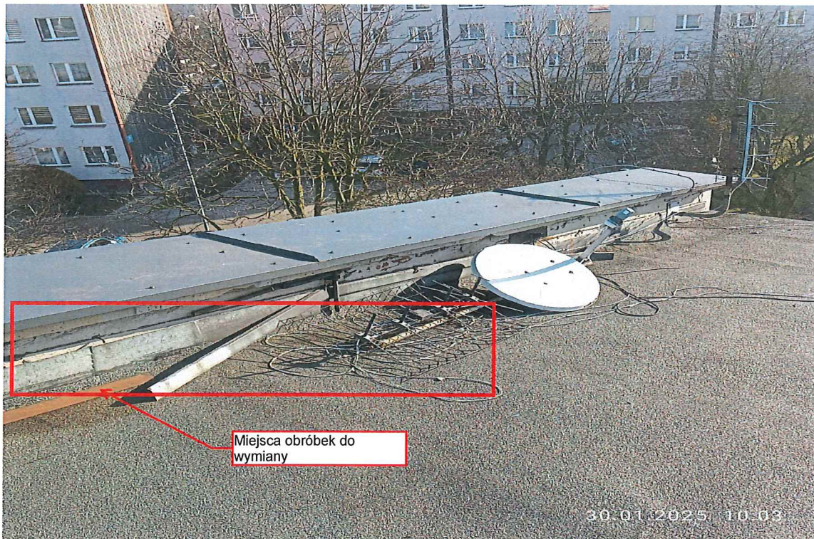
Fot. 5a Widok fragmentu muru ogniowego z uszkodzeniami oraz nieszczelnościami obróbek blacharskich