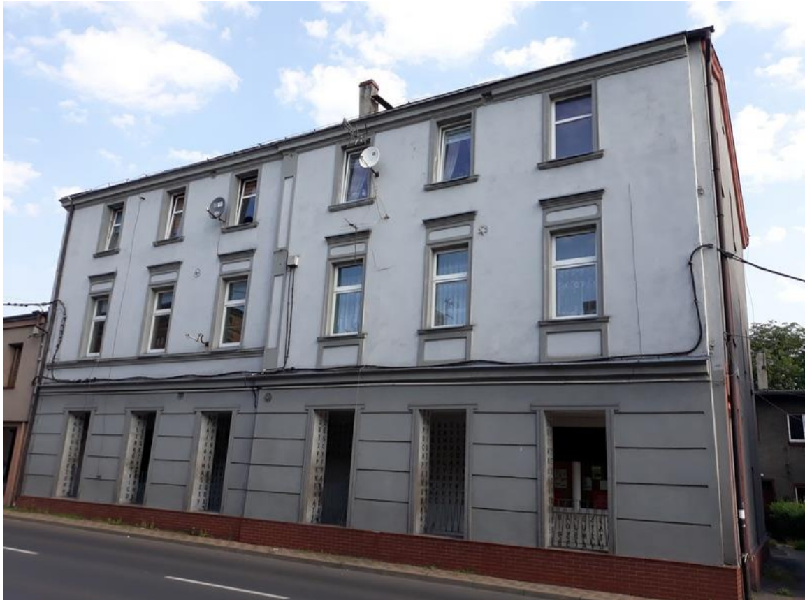
Fot. 8. Widok budynku od strony ul. Wyszyńskiego.