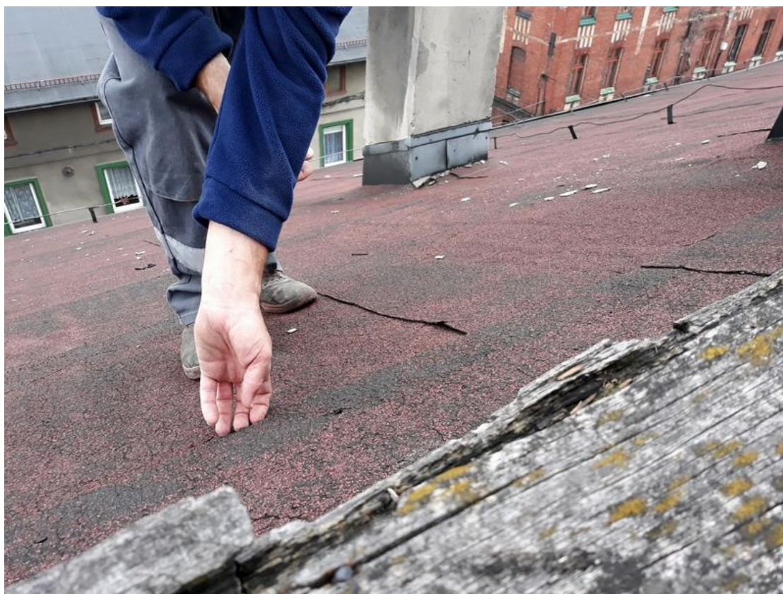
Fot. 1. Widok połaci dachowej od strony ul. Wyszyńskiego 31.