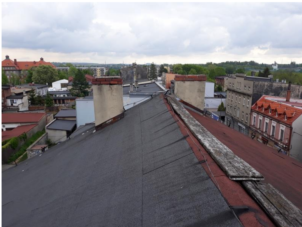
Fot. 4. Widok połaci dachowej od strony podwórza.