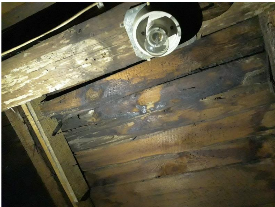
Fot. 5. Widok więźby i deskowania od strony poddasza.