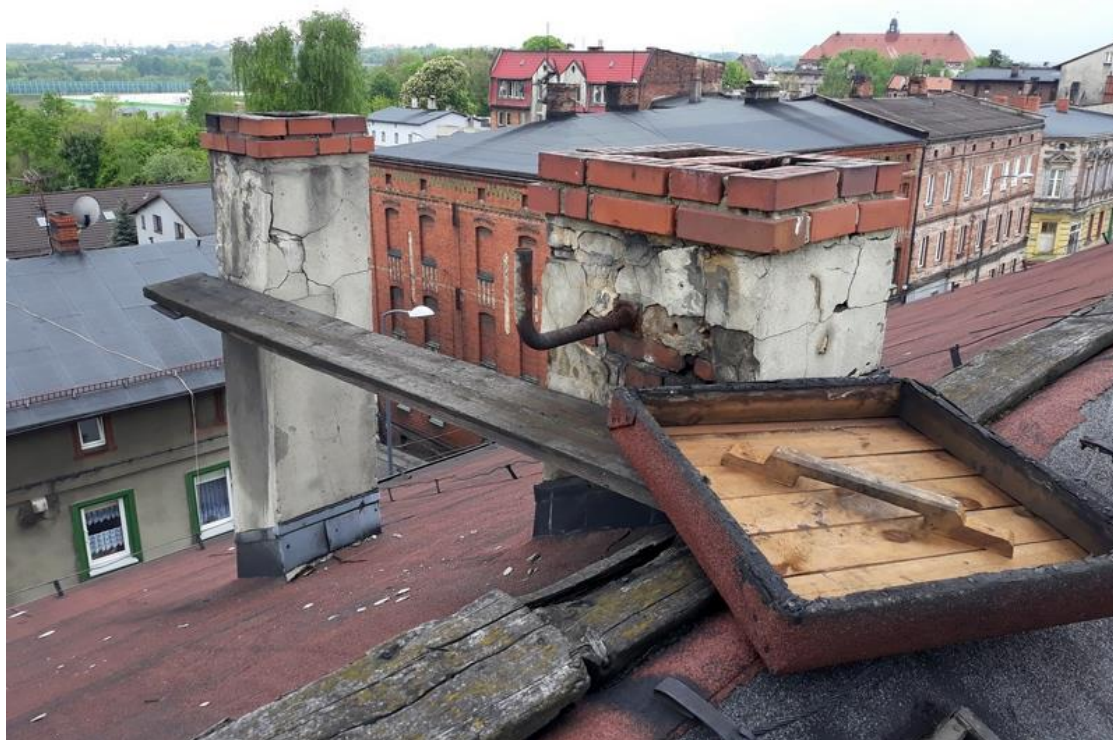
Fot. 2. Widok połaci dachowej od strony ul. Wyszyńskiego 31.