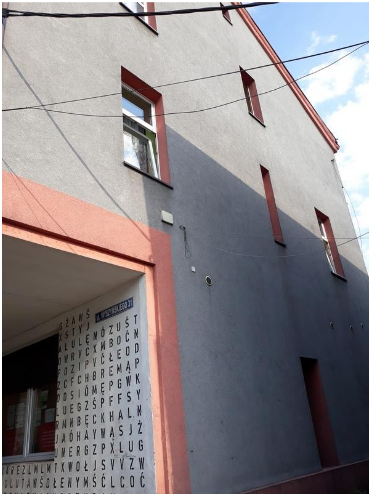
Fot. 10. Widok ściany szczytowej.