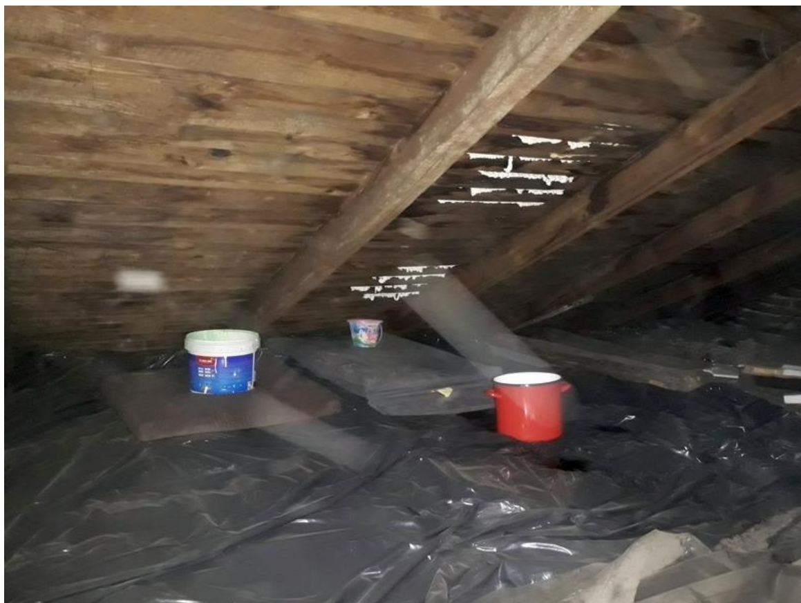
Fot. 6. Widok deskowania oraz więźby od strony poddasza.