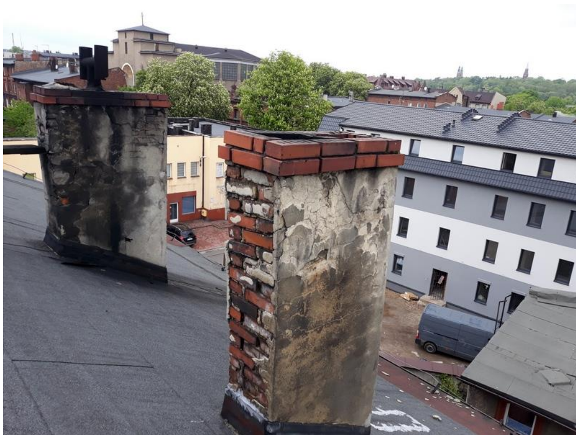
Fot. 2. Widok połaci dachowej od strony podwórza.