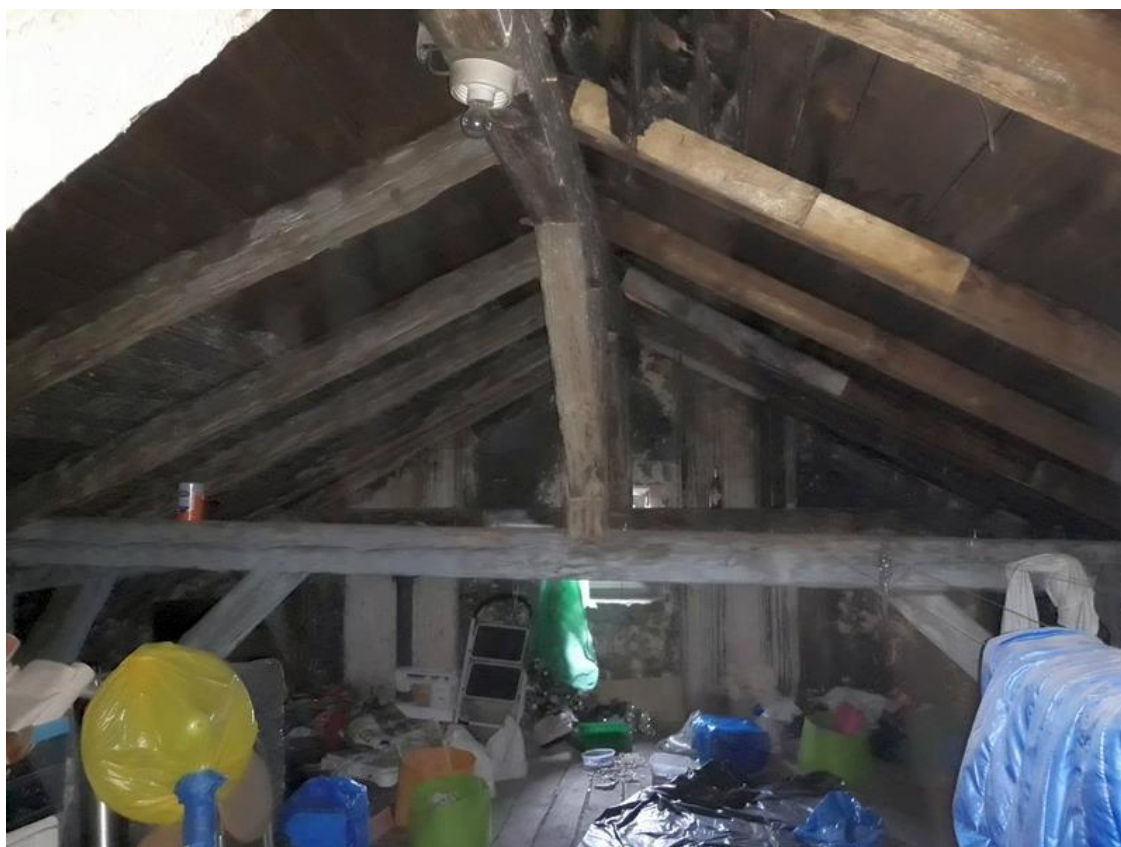
Fot. 6. Widok więźby dachowej i deskowania od strony poddasza.